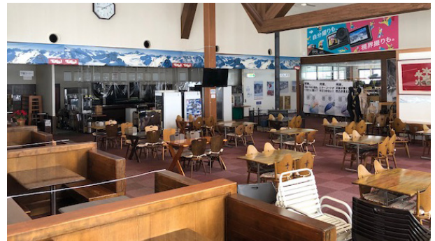
レストラン サンクリストフ