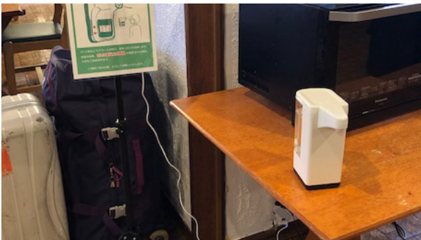
クルックスール入口