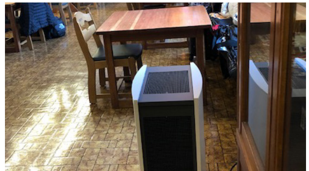
クルックスール空気清浄機